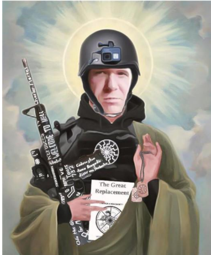
Brenton Tarrant'ın çevrimiçi aşırı sağcı ağlarda Hristiyan azizi olarak tasvir edilmesi.

Mart 2019'da Yeni Zelanda'nın Christchurch kentinde 51 Müslümanı katleden Brenton Tarrant, çevrimiçi ağlar tarafından anında "aziz" ilan edilmiş ve başının etrafında dini bir hale ile tasvir edilmiştir. Tarrant'tan önce ve sonra gelen birçok saldırı faili; 2011 Norveç saldırganı Anders Breivik, Unabomber Ted Kaczynski, Atomwaffen Division üyeleri ve 1995 Oklahoma bombacısı Timothy McVeigh bu "kutsal" dijital panteona eklenmiştir. Hatta şiddete duyulan fanatik hayranlığın, siyasi ideolojinin tamamen önüne geçtiğinin en büyük kanıtı olarak, aşırı sağla hiçbir bağlantısı olmayan ve 900'den fazla takipçisini intihara sürükleyen Jonestown tarikatı lideri Jim Jones bile bazı aziz listelerinde kendisine yer bulabilmiştir.