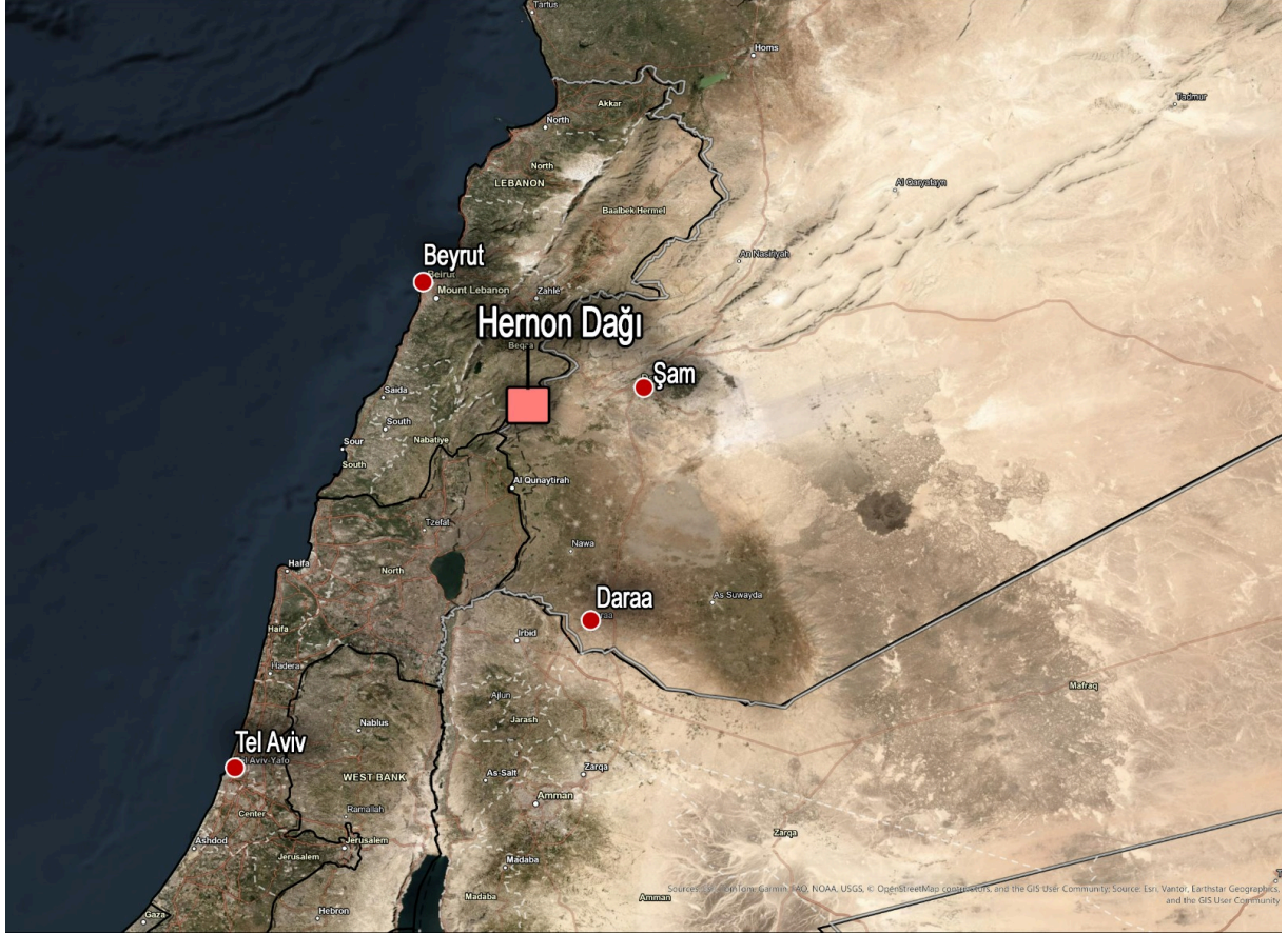
Harita 2. Hernon Dağı

Hernon Dağı'ndan çekilmeyeceklerini açıklamıştır 18 . İsrail ayrıca 2025'te Süveyda'daki Dürzi çatışmaları sırasında Suriye hükümet güçlerini hedef almış ve bunu Dürzileri koruma şeklinde gerekçelendirmiştir.