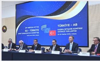
"Jeopolitik belirsizlikte dayanıklılığın yolu çeşitlendirmeden geçiyor"