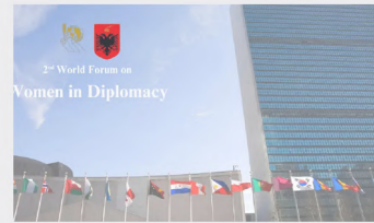
TEPAV'ın kapsayıcı barış yaklaşımı Birleşmiş Milletler'de paylaşıldı