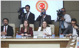
"Türkiye'de okul saldırısı oranı ABD ile benzer düzeye ulaştı"